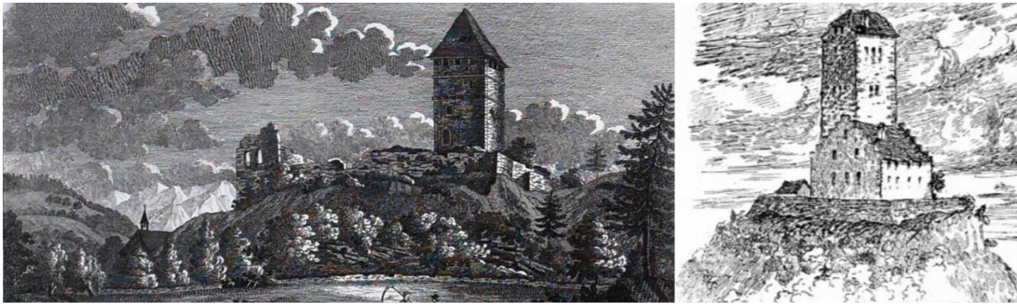
Die Burg Blatten (links nach einem Stahlstich von Conrad Sulzberger um 1805) und die zwischen 1311 und 1319 erbaute Burg Neu-Montfort (rechts die Darstellung auf dem Bildstock an der Kirche St. Arbogast bei Götzis, nach Skizze von Hand Ender gezeichnet von F. Lins) hatten große Ähnlichkeiten. Neu-Montfort hatte einen fünfstöckigen Wohnturm (bei Blatten waren es sechs Stockwerke). Im Westen war bei Neu-Montfort ein Palas angebaut. Ein solches Gebäude bestand auch bei Blatten.

1274 zu Hagenau den Hof (samt Leuten und allen Gütern einschließlich des Forsts) wieder zu seinen Händen und versprach, diesen nie wieder (weder durch Verkauf noch durch Verpfändung oder Belohnung) zu veräußern, sondern alles beim alten Recht zu belassen (Freiheitsbrief). Die Burg Blatten blieb dabei jedoch beim Kloster St. Gallen.