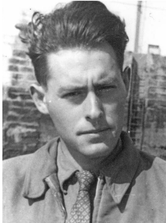
Alfons Eschenmoser als junger Mann.