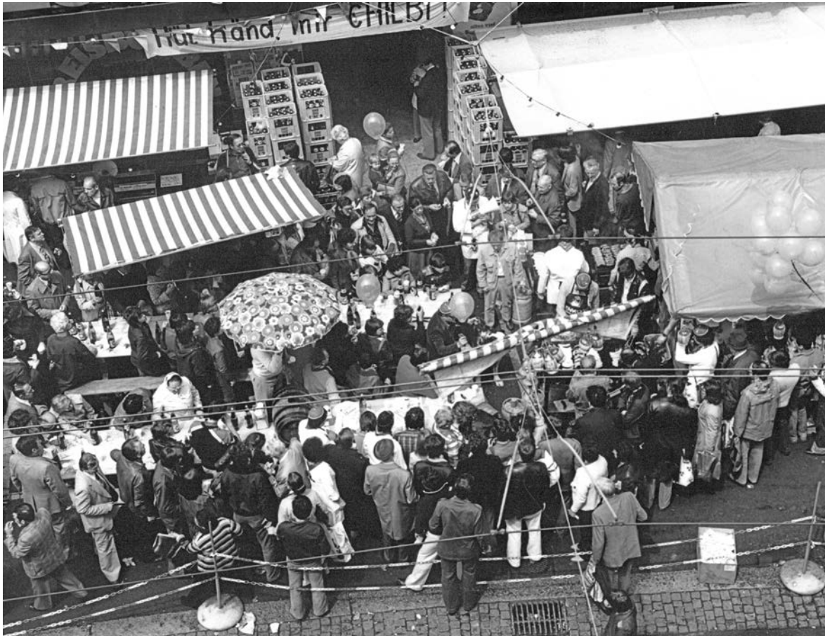
1976 bis in die ersten Achtzigerjahre fand alljährlich vor dem Zürcher Geschäftshaus die Chilbi statt.

Der Arbeitsplatz des Chefs: Im grossen Geschäftshaus an der Birmensdorferstrasse 20 am Stauffacher hatte Alfons Eschenmoser einen Lieblingsarbeitsplatz. Dieser befand sich neben dem Haupteingang und wurde auch «Stall» genannt. Es handelte sich um eine etwa vier Quadratmeter grosse, halboffene Zentrale, die durch Schwingtüren zu betreten war – ähnlich wie die Saloons im «Wilden Westen». Im Stall befand sich ein grosses Pult, die Telefonhauszentrale, darüber Moni-