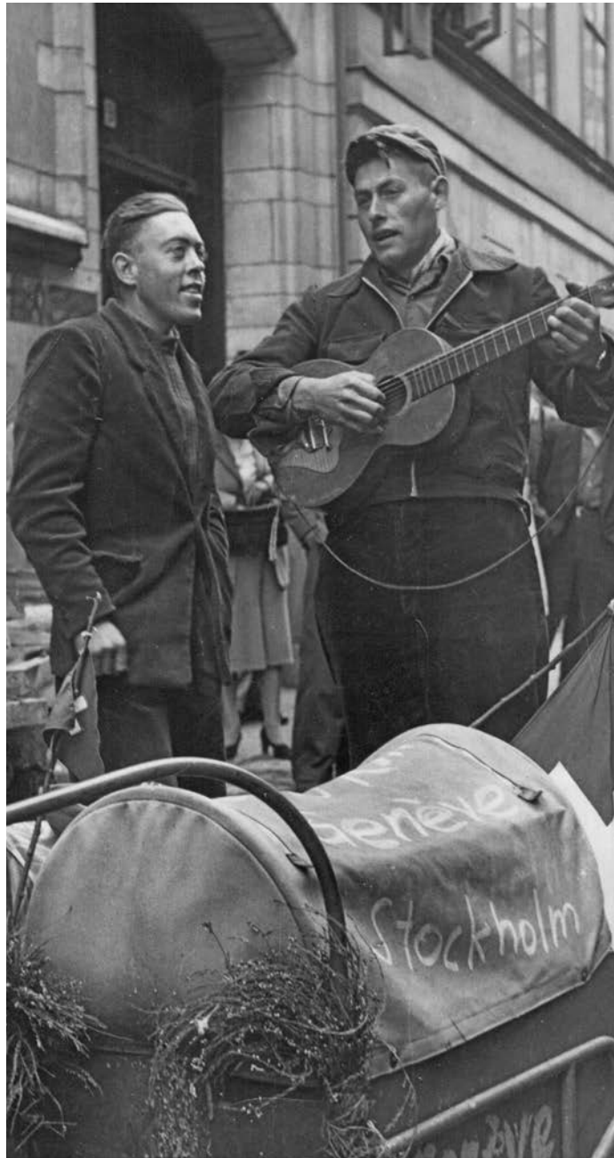
Alfons Eschenmoser (rechts) und Marcus Bossard auf der Walz, 1948.

gebenheit, welche eine geradezu missionarische Stimmung von Alfons zur Zeit seines Aufbruchs wiedergibt: «1948, kurz vor Aufbruch in die Wanderschaft, besuchte mich Alfons an der ETH. Ich nahm ihn an eine Soziologie-Studentenseminar-Stunde mit. Bei der anschliessenden Diskussion der Studenten mit dem Professor ergriff Alfons spontan das Wort und hielt eine unter den im Hörsaal Anwesenden Aufsehen erregende Brandrede über die Engstirnigkeit der Jugend in der Schweiz und propagierte Auslandsaufenthalte als Heilmittel. Auf die Frage des Professors «Was studieren Sie, Herr Eschenmoser?», antwortete Alfons stolz: «Ich bin Mechaniker», worauf der Professor kommentierte: «Da sind Sie aber weit über die Mechanik hinausgewachsen.»»