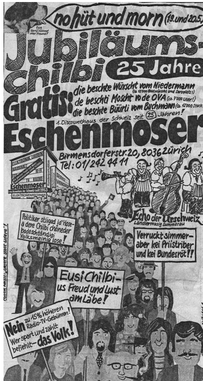
Inserat zur Jubiläums-Chilbi mit angriffigen Parolen, 1978.

Die zweite Geschichte beschreibt eine Episode, die meinem Onkel, dem Chemiker, in Israel passiert ist: «Früh morgens auf dem Flughafen Lodz in Israel, vor dem Rückflug nach Zürich von einer meiner Vortragsreisen nach Israel, gelange ich mühsam nach langem Schlangestehen und aufregendem, jedoch erfolgreichem Passieren der scharfen Sicherheitskontrollen endlich an die Passkontrolle: Der Beamte hinter dem Desk nimmt meinen roten Pass, blättert in ihm, sieht mich an, und fragt: «Do you sell radios?»»